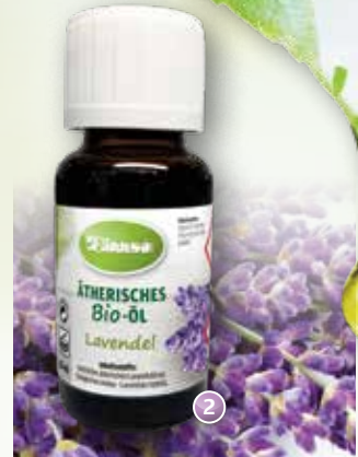
Bio-Lavendel Lavandula hybrida (Bulgarien)

Duftprofil: mild, frisch, blumig Duftwirkung: entspannend, konzentrationsfördernd Gewinnung: Wasserdampfdestillation des Krautes