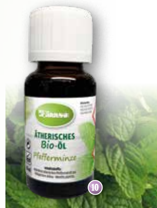
Bio-Pfefferminze Mentha piperita (Indien)

Duftprofil: kühl, frisch Duftwirkung: hemmt Aufregung, steigert Wohlbefinden Gewinnung: Wasserdampfdestillation der Blätter