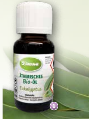
Bio-Eukalyptus Eucalyptus globulus (China)

Duftprofil: frisch Duftwirkung: ausgleichend, stimulierend, kühlend Gewinnung: Wasserdampfdestillation der Blätter