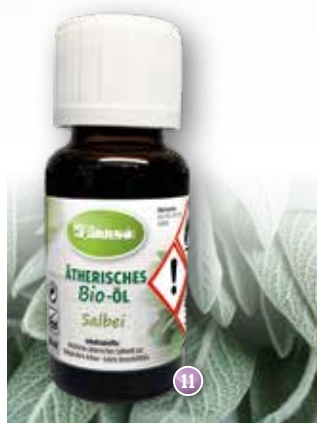
Bio-Salbei Salvia lavandulifolia (Spanien)

Duftprofil: krautig, frisch Duftwirkung: beruhigend, belebend Gewinnung: Wasserdampfdestillation