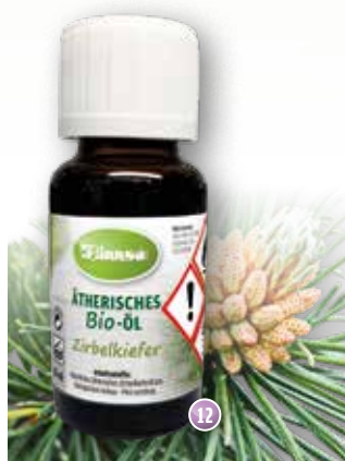
Bio-Zirbelkiefer Pini cembrae (Alpen)

Duftprofil: frisch, holzig Duftwirkung: ausgleichend, belebend, stärkend Gewinnung: Wasserdampfdestillation der Zirbenteile