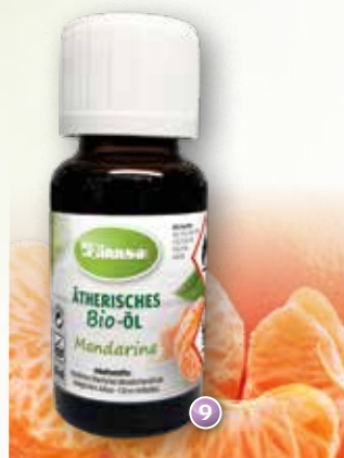
Bio-Mandarine Citrus reticulata (Mexiko)

Duftprofil: fruchtig, frisch Duftwirkung: aktivierend, konzentrationsfördernd, ausgleichend Gewinnung: Kaltpressung der Fruchtschalen