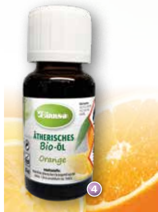
Bio-Orange Citrus aurantium var. Dulcis (Mexiko)

Duftprofil: fruchtig, frisch Duftwirkung: aktivierend, konzentrationsfördernd, ausgleichend Gewinnung: Kaltpressung der Schalen