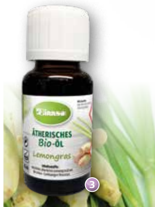
Bio-Lemongras Cymbopogon flexuosus (Indien)

Duftprofil: zitrusartig, frisch Duftwirkung: vertreibt Müdigkeit, belebend Gewinnung: Wasserdampfdestillation des frischen Grases