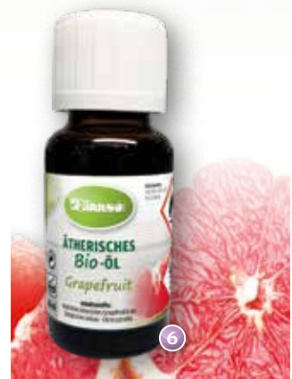
Bio-Grapefruit Citrus paradisi (Argentinien/USA)

Duftprofil: frisch, kühl, spritzig Duftwirkung: anregend, belebend Gewinnung: Pressung der Schalen