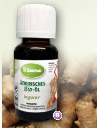
Bio-Ingwer Zingiber officinale (Sri Lanka)

Duftprofil: würzig, frisch Duftwirkung: ausgleichend, belebend Gewinnung: Wasserdampfdestillation der Wurzel