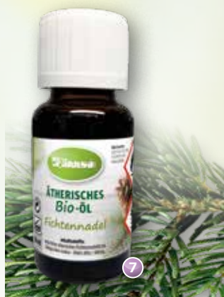
Bio-Fichtennadel Abies alba, Abies sibirica (Russland)

Duftprofil: frischer, würziger Waldduft Duftwirkung: belebend Gewinnung: Wasserdampfdestillation d. Nadeln u. Zweige