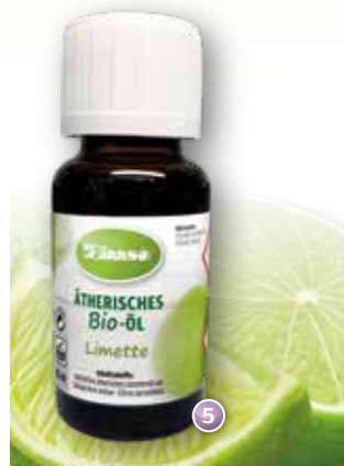
Bio-Limette Citrus aurantifolia (Sri Lanka)

Duftprofil: frisch, kühl, spritzig Duftwirkung: aufmunternd, erfrischend Gewinnung: Kaltpressung und Destillation von Saft und Öl